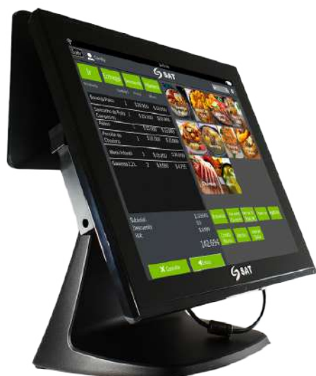
EQUIPO AIO SAT CI150