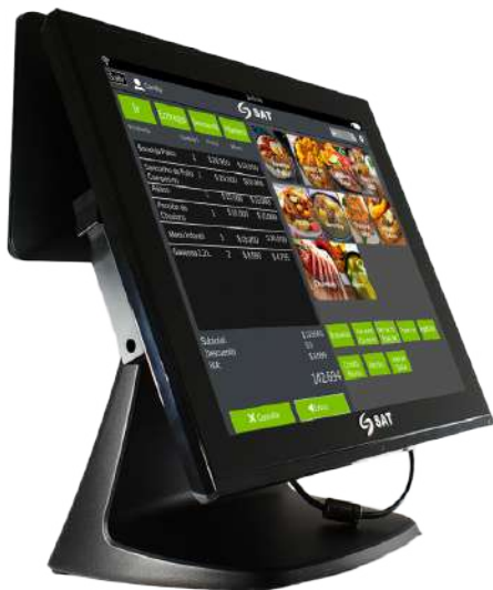
EQUIPO AIO SAT CI150