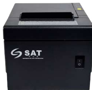
Impresora Térmica SAT 38T