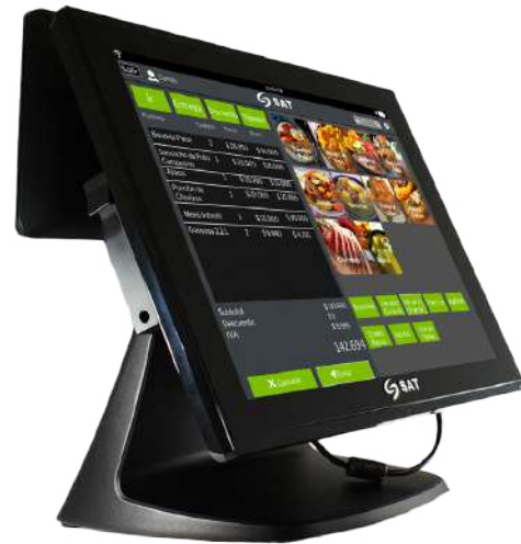
EQUIPO AIO SAT CI150