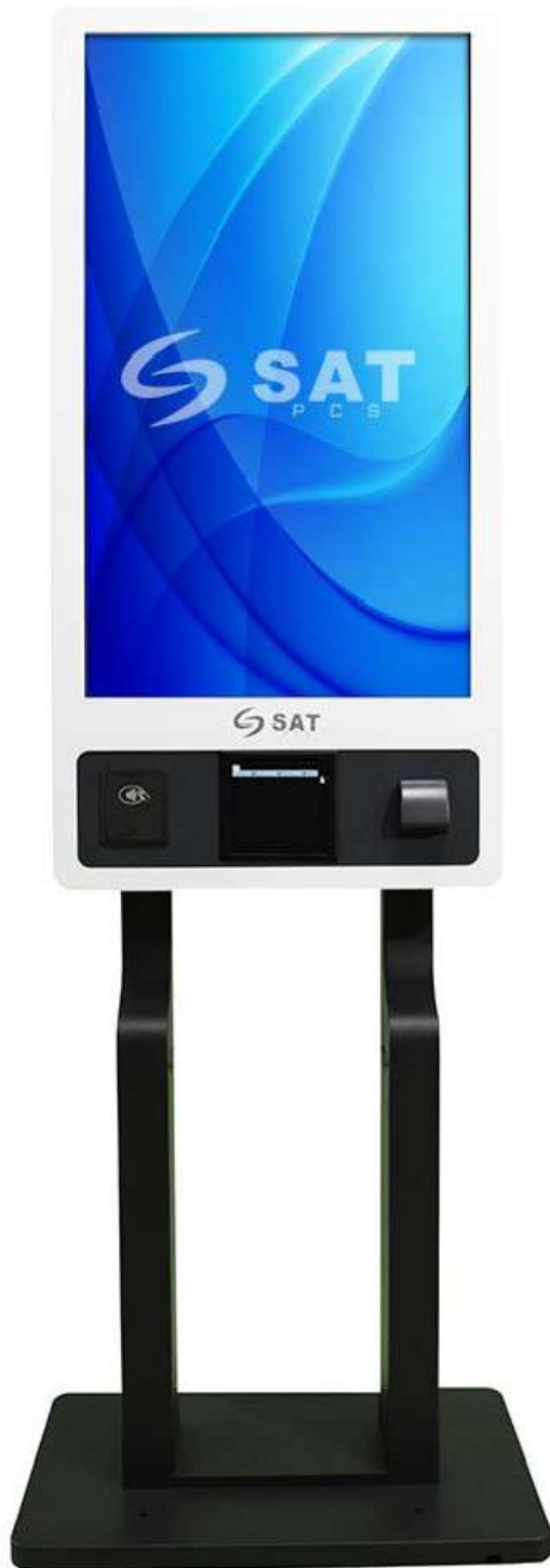
Kiosco SAT KT32