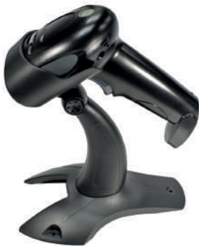
SAT AI402 ID OCR