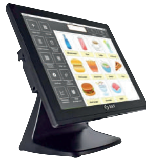
AIO POS CI150