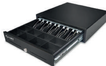
Cajón monedero SAT 119Z