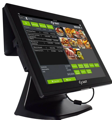
EQUIPO AIO SAT CI150