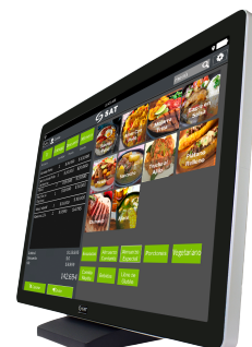
Monitor Touch Industrial 3023 FPH