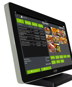
Monitor Touch Industrial 2013 FPH