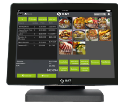
Monitor Touch Industrial 1053 FPH