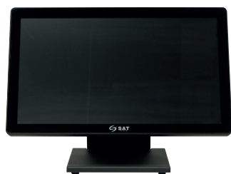
Equipo AIO con Base