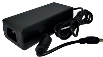
Adaptador de Voltaje