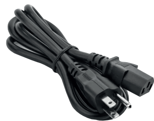
Cable de Poder