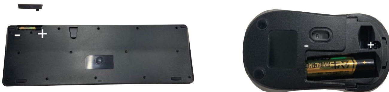
Batería x1 AAA 1.5V 5ma Max

2. Inserte la batería teniendo en cuenta el lado positivo y negativo como se muestra en la imagen.