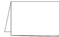
Guia de inicio rápido